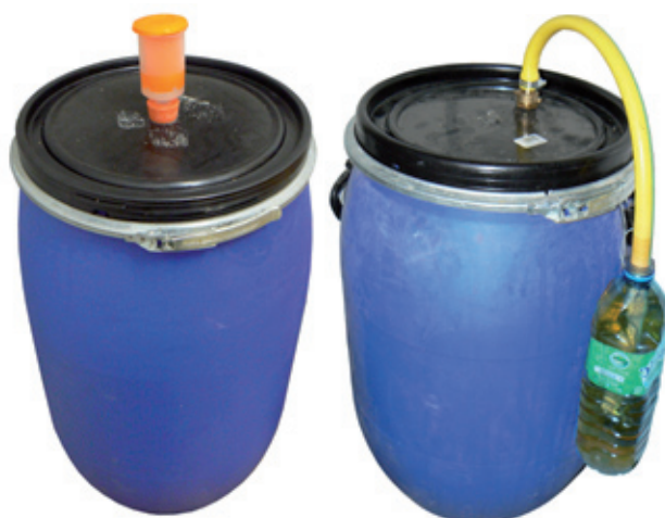
Bonde de fermentation

Il est important de stocker vos récipients dans un local chauffé à une température dans l'idéal de 18-20°C. Il peut être utile d'isoler le récipient du sol à l'aide d'une palette